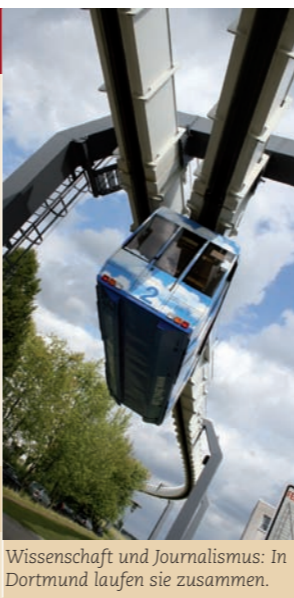
Wissenschaft und Journalismus: In Dortmund laufen sie zusammen.